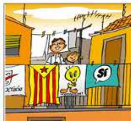
18. Amb l'estelada al terrat, se'l veu entremaliat.