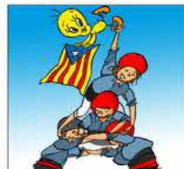
19. Quan fa el cim amb l'enganeta li salta de la maneta.