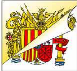
5. que ens esperoni en la lluita per poder girar la truita.