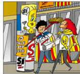
11. I per més que faci nosa l'ocellet arreu es posa.