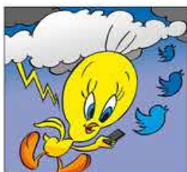
21. Ell, com a ocell, fa piulades i se'n fot, de les tronades.