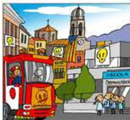
17. L'escola el vol adoptar, el bomber i el capellà.