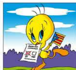
23. Al bec du la papereta amb el Sí, que tot ho peta.