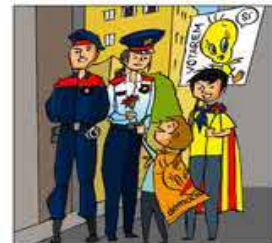
16. Fa goig pintat als vaixells i als mossos, donant clavells.