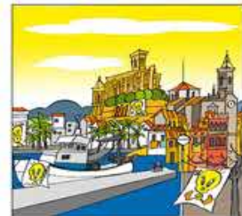
12. A Alcanar a Manresa, a Olot... pots trobar-hi aquest ninot.