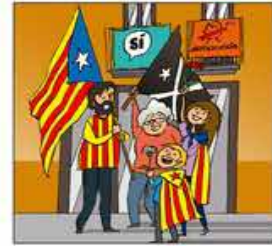
4. Com a símbol de combat una mascota hem cercat