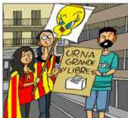
13. Diu ben alt que vol votar, que ningú l'en privarà.