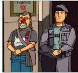
2. Remor per la democràcia que perdem i no ens fa gràcia.