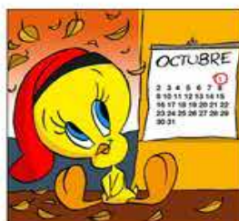
22. Mentre mira el calendari refilant com un canari.