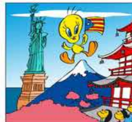
15. I fins fa d'ambaixador des d'Amèrica al Japó.