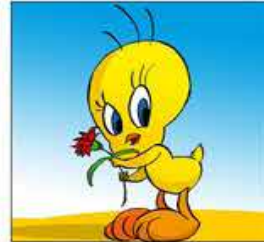
7. És un canari menut, llest, valent i molt astut