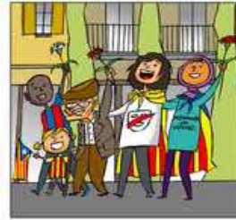
3. Davant d'això, sense por, rebutgem la repressió.