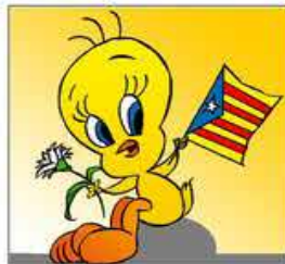
10. Però, ja és tard i en Piuet es passeja amb el cap dret