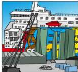
9. Davant d'aquest nou invent el vaixell tapen rabent.