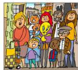
24. I així en Piuet s'ha guanyat, el cor de tot el veïnat.