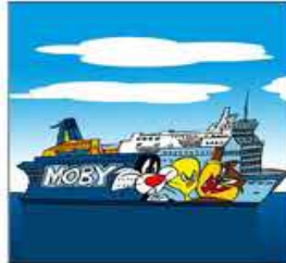
6. Prop del moll de Barcelona apareix la nova icona.