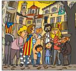
1. Arribada la tardor, al Principat hi ha remor.