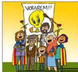
14. Que res no té més encert que un referèndum obert.