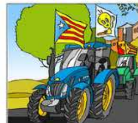
20. Amb la colla dels tractors va i entona els Segadors.