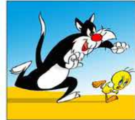
8. que s'escapoleix d'un gat ruc, ferotge i malcarat.