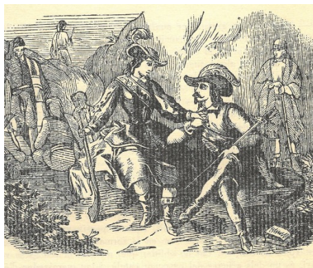
Il·lustració de la Cançó d'en Serrallonga, tal com apareix al llibre de Josep Gibert (1948) que ha servit per donar títol a l'article.

Si donem per bo aquest plantejament, és fàcil acceptar que una gran part dels catalans tinguem la sensació de compartir amb el col·lectiu social dels que són fora de la llei uns mateixos desigs de llibertat. Sovint difereixen pel que fa a l'aplicació d'aquesta llibertat: per a uns, tenir la possibilitat d'abandonar les pràctiques delictives en ser satisfetes